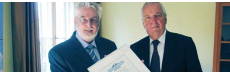
URBAN MINING® Award Preisträger 2011: Prof. Dr. Klaus Töpfer (r.)